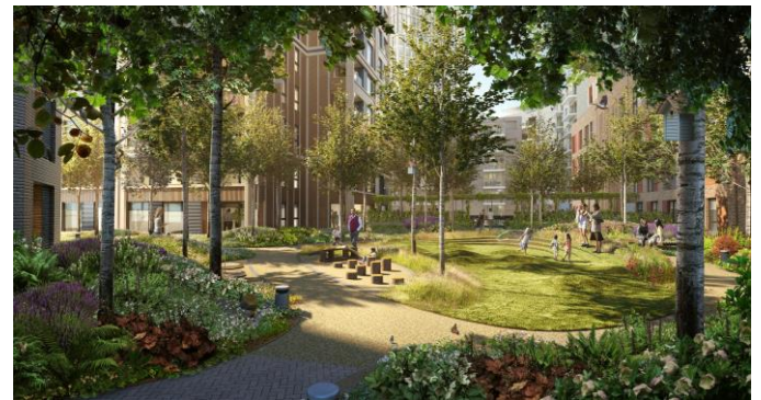
Highwood Gardens' courtyard