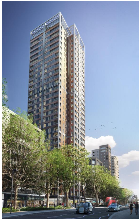
The Highwood' – 31 storey tower in the Highwood Gardens neighbourhood