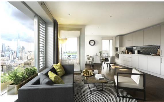
Art Deco interior- two bed home in The Highwood