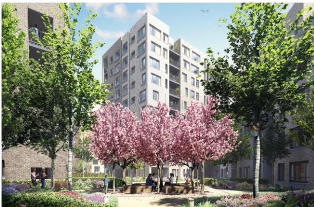
Orchard Gardens' courtyard

时间及距离为估计数字，来源： www.tfl.gov.uk , 2014 年 8 月