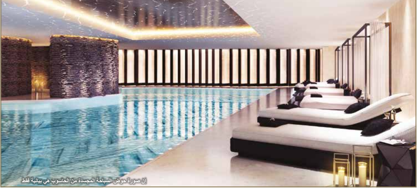
إن صورة حوض السباحة المجددة من الحاسوب هي بيانية فقط