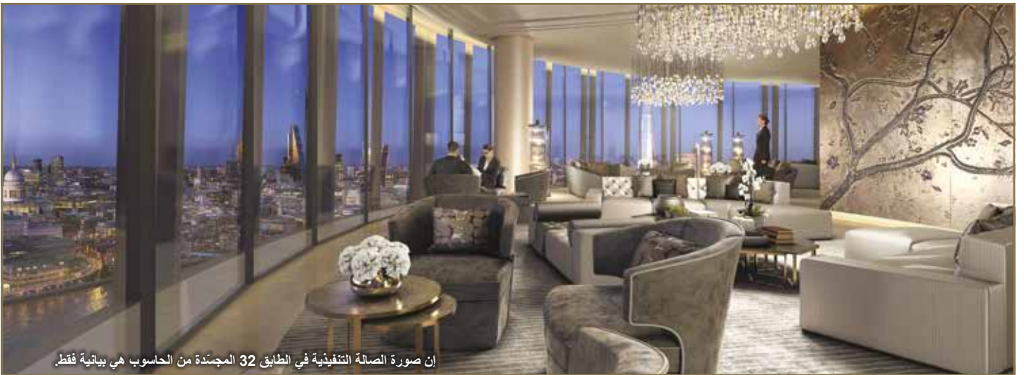
إن صورة الصالة التنفيذية في الطابق 32 المجددة من الحاسوب هي بيانية فقط.