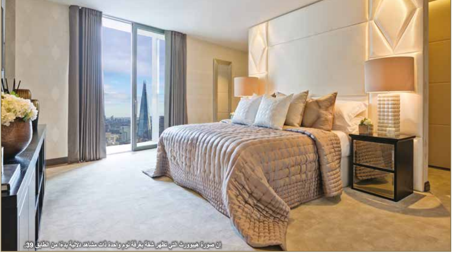
إن صورة هيبورث التي تظهر شقة بغرفة نوم واحدة ذات مشاهد دلالية بدءًا من الطابق 39.