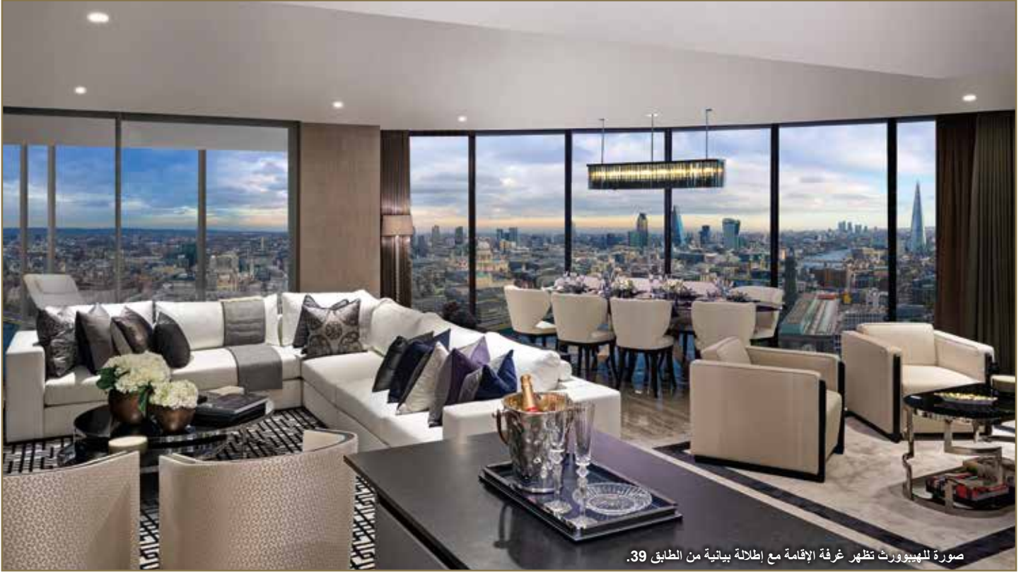
صورة للهيبورث تظهر غرفة الإقامة مع إطلالة بيانية من الطابق 39.