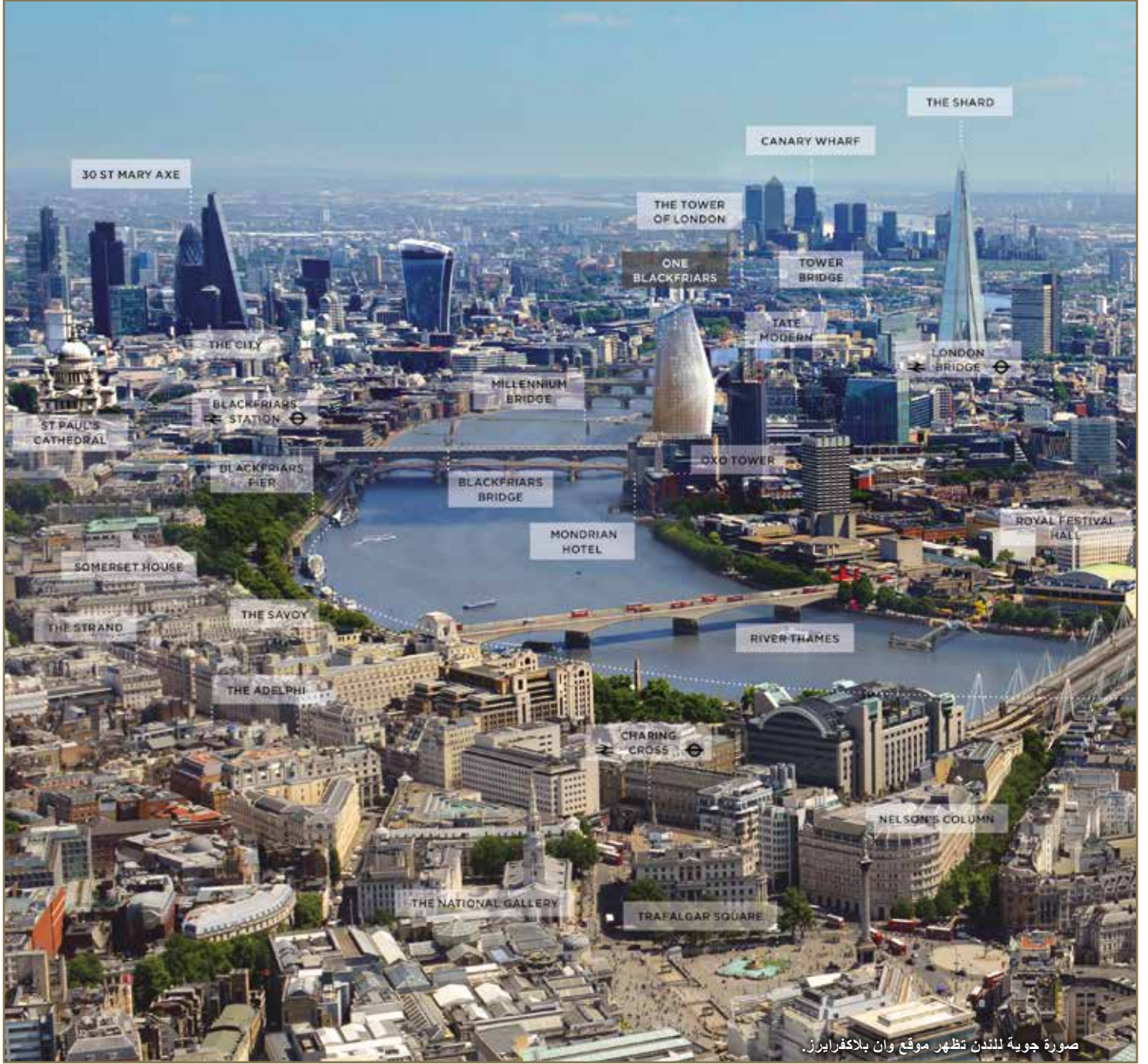
صورة جوية للندن تظهر موقع وان بلاكفرايرز.

تقع وان بلاكفرايرز في أفضل موضع في العاصمة. حيث تقع على بعد أربع دقائق فقط من محطة بلاكفرايرز، بينما يوفر موقعها الرائع ومواصلات النقل هناك وصولاً سريعاً للشركات والمحلات التجارية والترفيه والسفر الدولي.