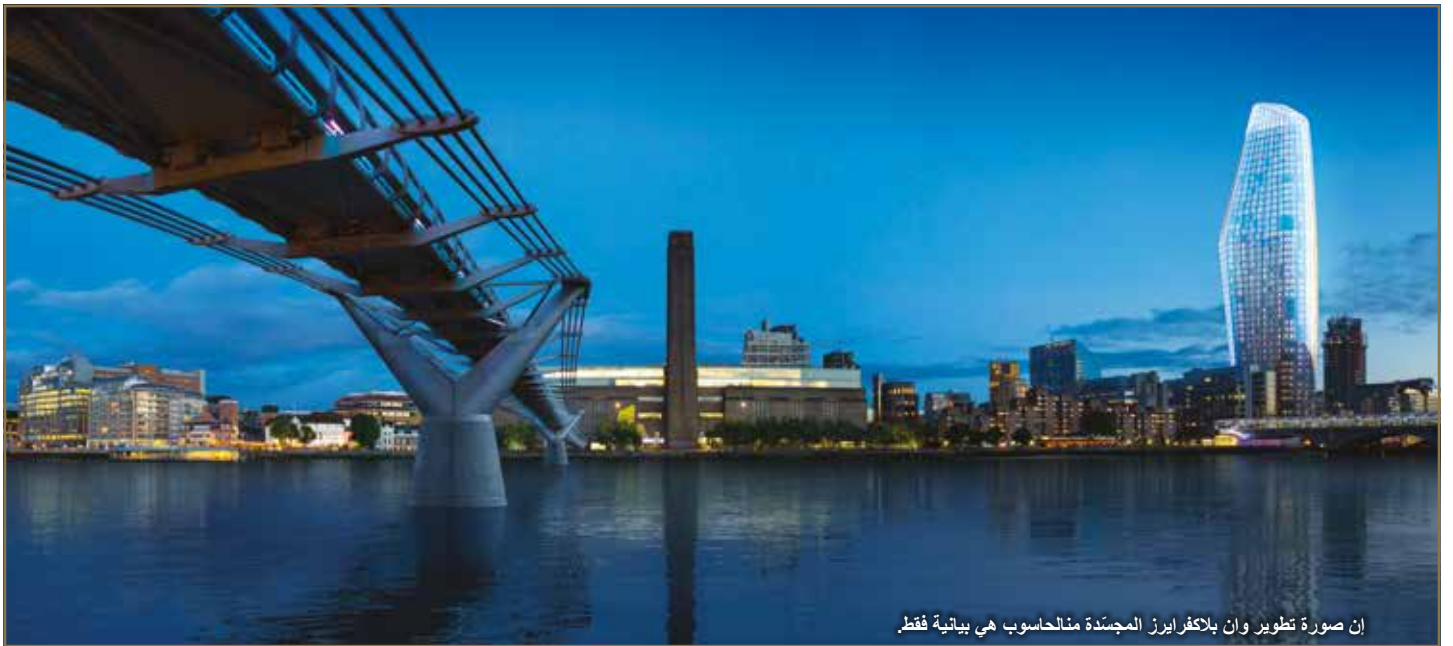
إن صورة تطوير وإن بلاكفرايرز المجسدة من الحاسوب هي بيانية فقط.