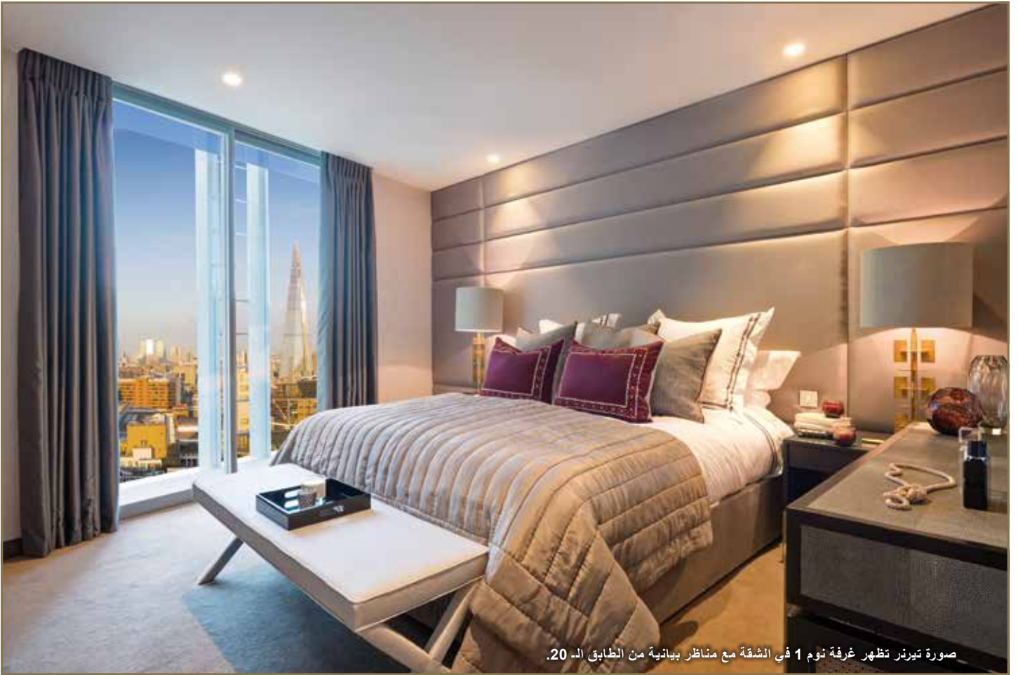
صورة تيرنر تظهر غرفة نوم 1 في الشقة مع مناظر بيانية من الطابق الـ 20.