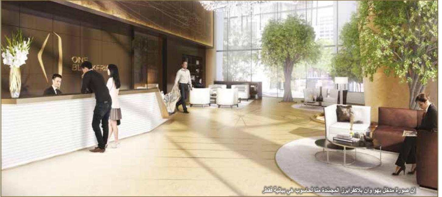
إن صورة مدخل بهو وان بلاكفرايرز المجسدة منا لحاسوب هي بيانية فقط