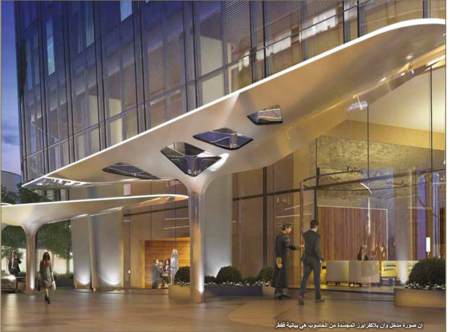
إن صورة مدخل وان بلاكفرايرز المجددة من الحاسوب هي بيانية فقط.