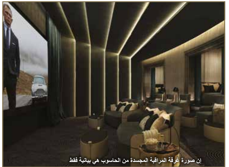
إن صورة غرفة المراقبة المجددة من الحاسوب هي بيانية فقط