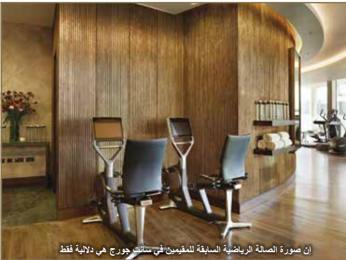
إن صورة الصالة الرياضية السابقة للمقيمين في سانت جورج هي دلالية فقط