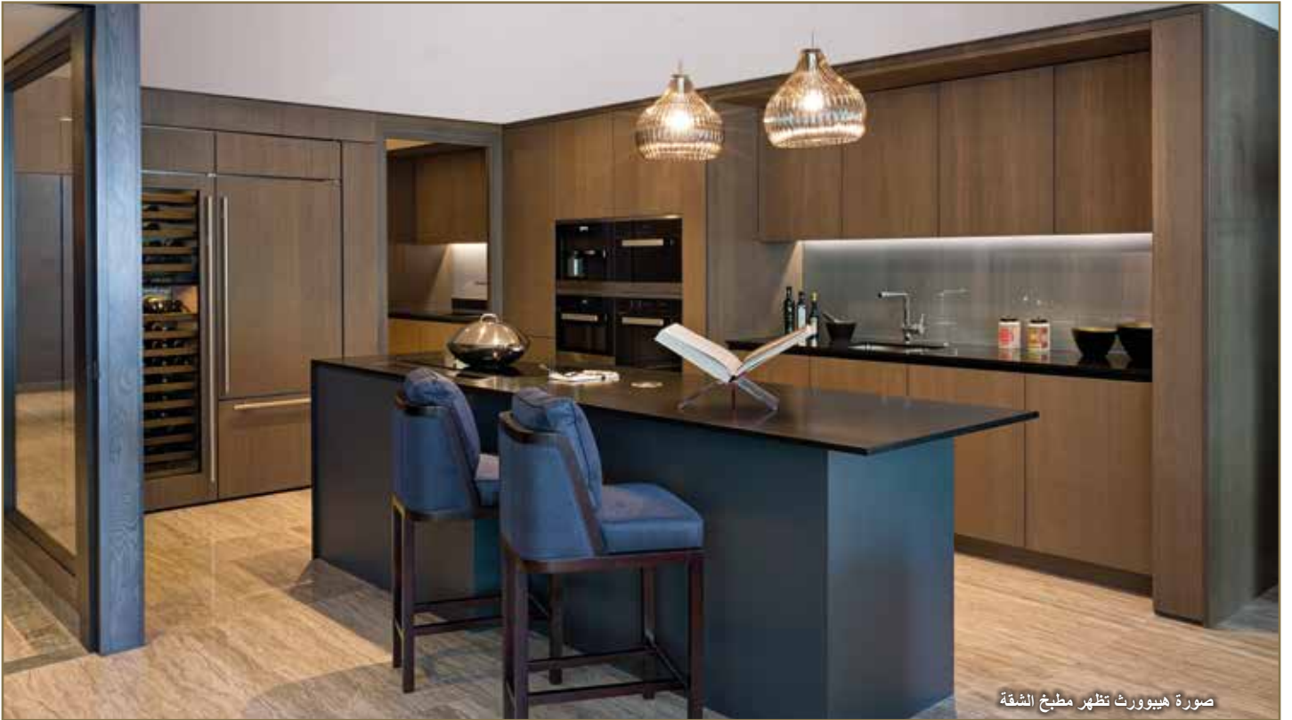
صورة هيبورث تظهر مطبخ الشقة