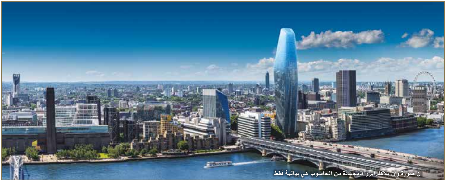
إن صورة وان بلاكفرايرز المجسدة من الحاسوب هي بيانية فقط

رسوم الخدمة موقف سيارات المكان الموقع ما يقرب من 6,50 جنيه استرليني لكل قدم مربع بالإضافة إلى موقف سيارات يتوافر موقف السيارات بـ100,000 جنيه استرليني للشقق ذات الغرفتين والثلاث غرف فقط وان بلاكفرايرز، وان بلاكفرايرز، لندن SE1 9UF يضم الموقع ثلاث مبانٍ في مساحة ما يقرب من 0,67 هكتار من الأرض تحتوي على مساحة خضراء مركزية