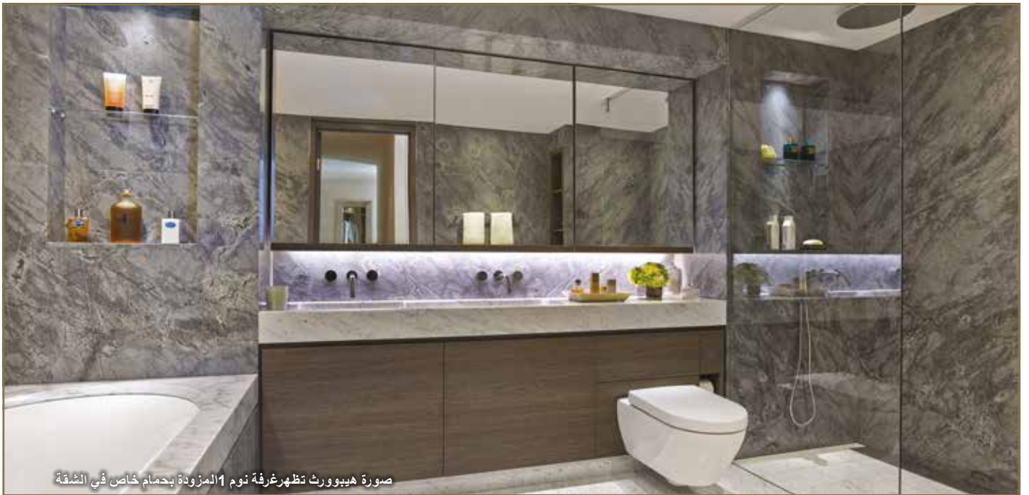
صورة هيبورث تظهر غرفة نوم 1 المزودة بحمام خاص في الشقة