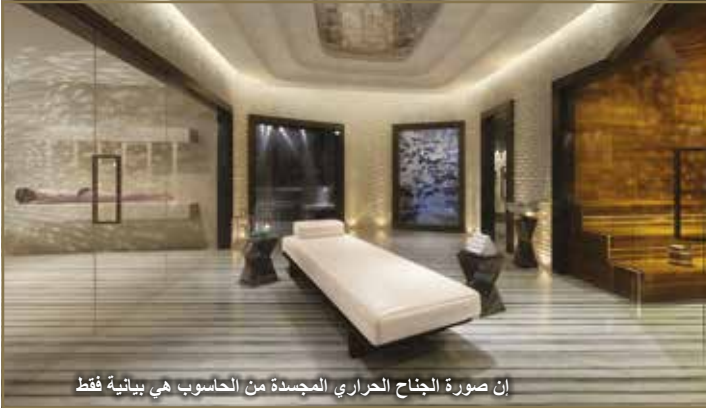
إن صورة الجناح الحراري المجددة من الحاسوب هي بيانية فقط