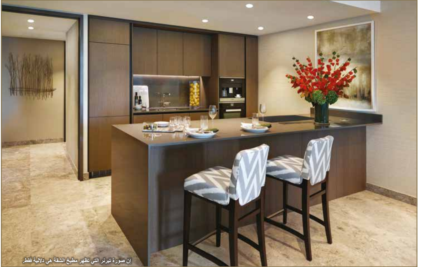
إن صورة تيرنر التي تظهر مطبخ الشقة هي دلالية فقط.