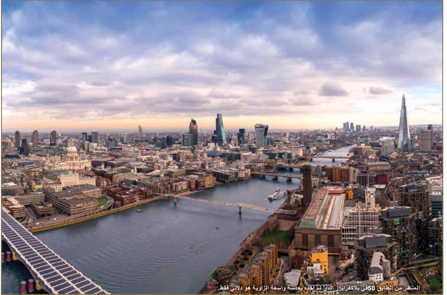
المنظر من الطابق 50 في بلاكفرايرز الذي تم أخذه بعدسة واسعة الزاوية هو دلالي فقط.