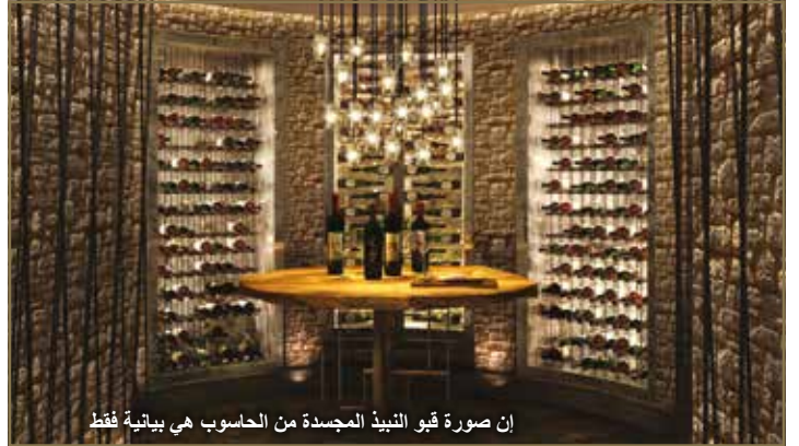
إن صورة قبو النبيذ المجددة من الحاسوب هي بيانية فقط