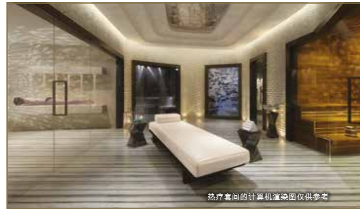
热疗套间的计算机渲染图仅供参考