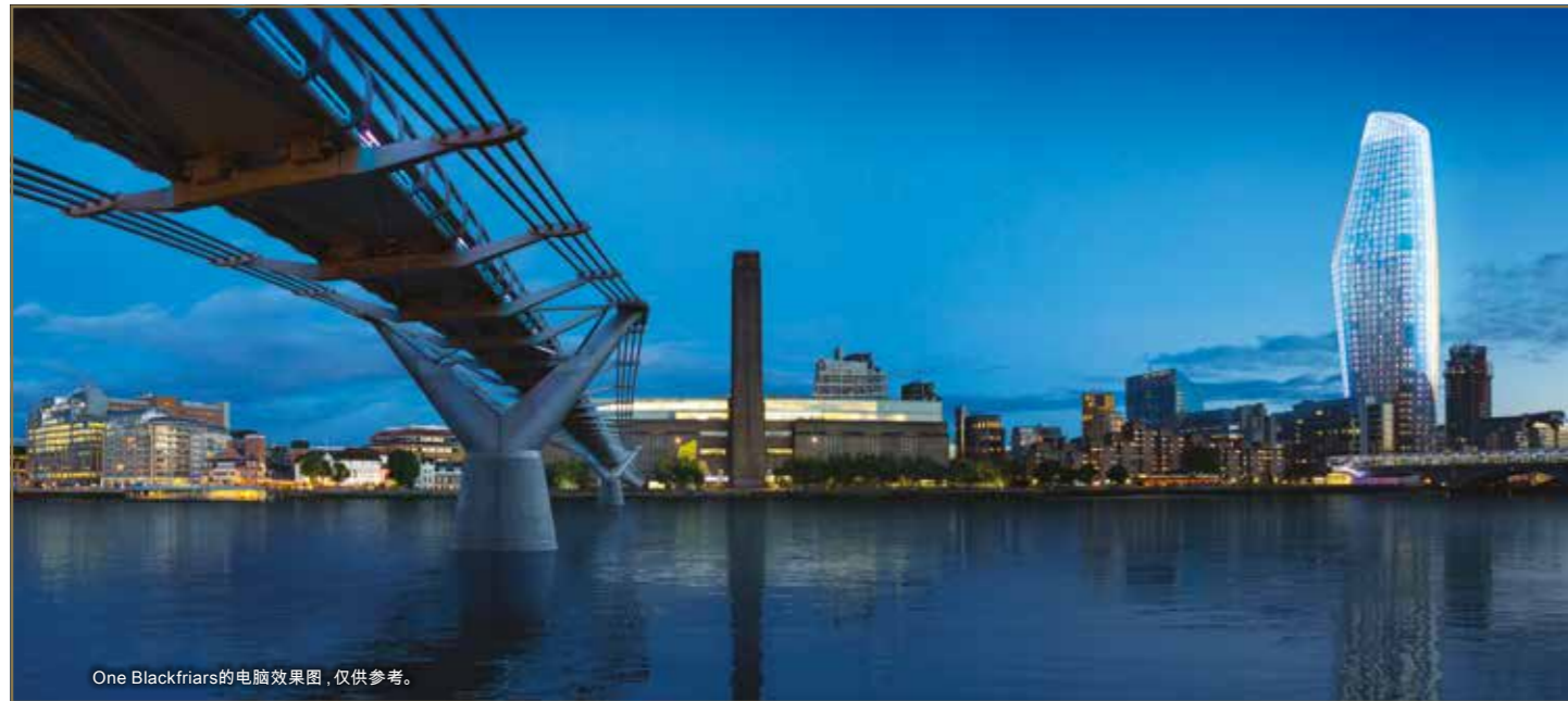
One Blackfriars的电脑效果图, 仅供参考。