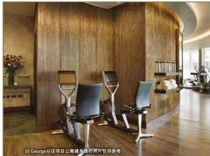
St George以往项目公寓健身馆的照片仅供参考