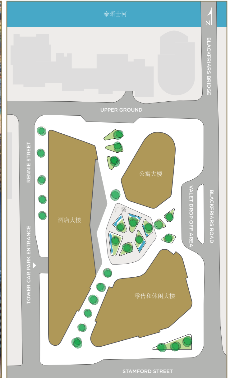
布莱克法尔一号项目规划图仅供参考。St George公司有权随时修改项目布局。

One Blackfriars 项目地处伦敦城市中心, 距离最新改造后的Blackfriars地铁站仅四分钟, 离Kings Cross(欧星铁路)仅十八分钟,由(欧星铁路)到巴黎仅二小时十五分钟, 优越的地理位置和发达交通配套为驻地企业、商家、休闲消费者和国际旅客提供了快速便捷的出行连接。