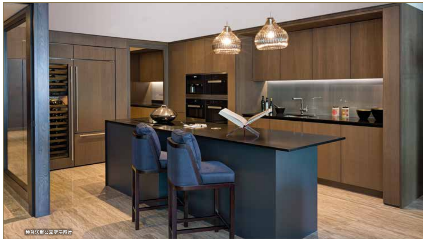
赫普沃斯公寓厨房图片