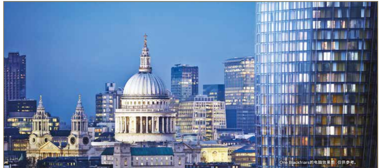
One Blackfriars的电脑效果图, 仅供参考。