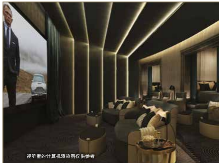
视听室的计算机渲染图仅供参考