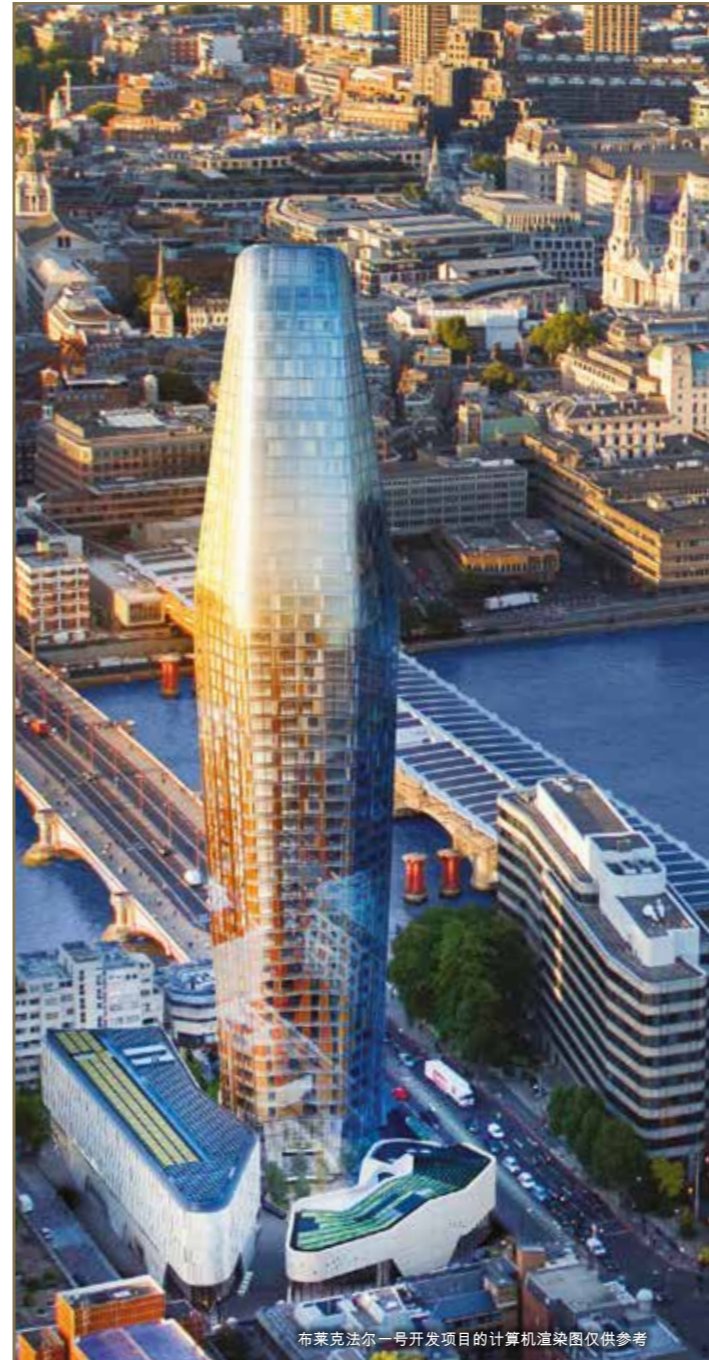
布莱克法尔一号开发项目的计算机渲染图仅供参考