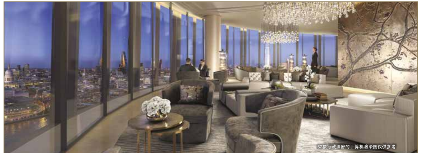
32楼行政酒廊的计算机渲染图仅供参考