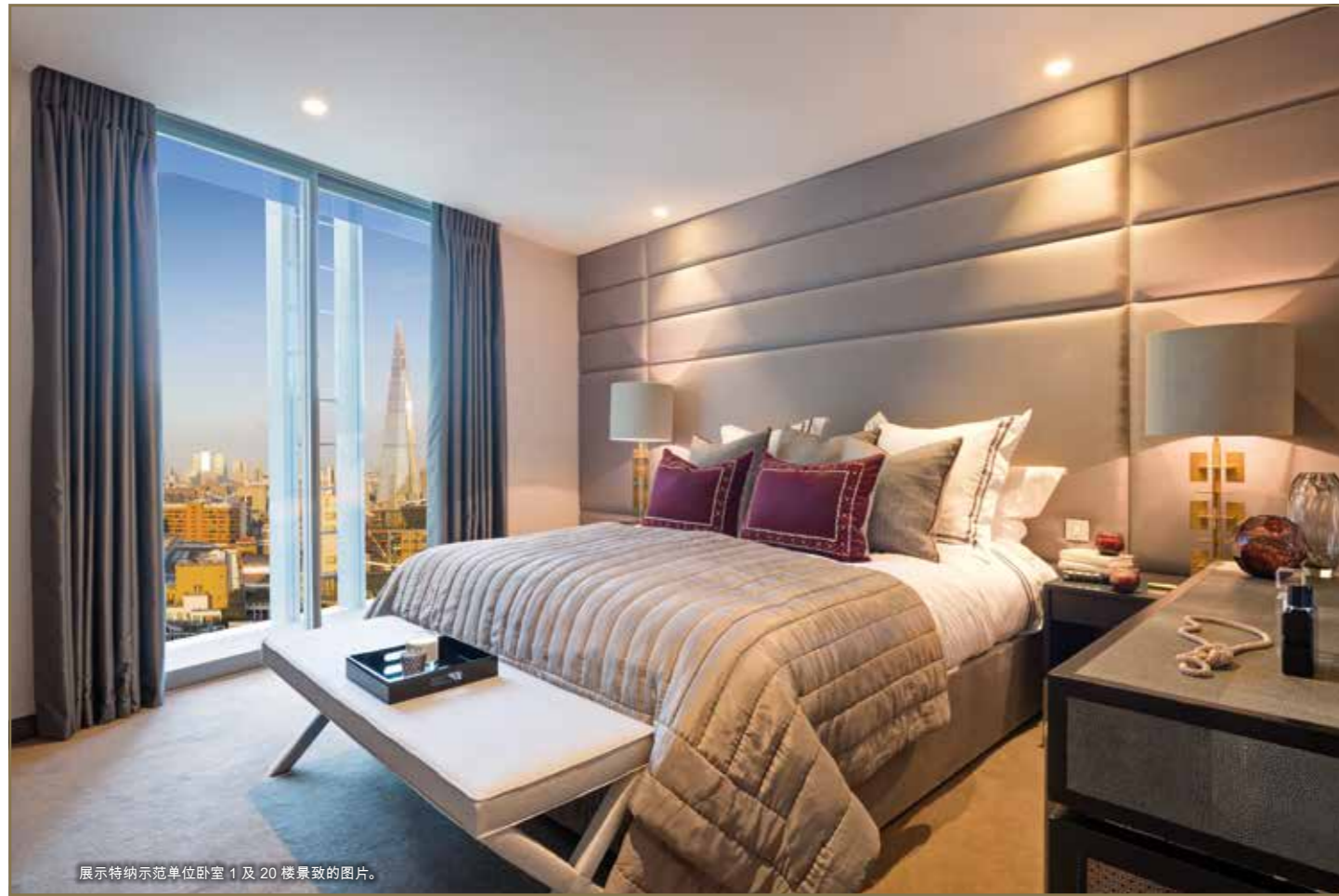
展示特纳示范单位卧室1及20楼景致的图片。