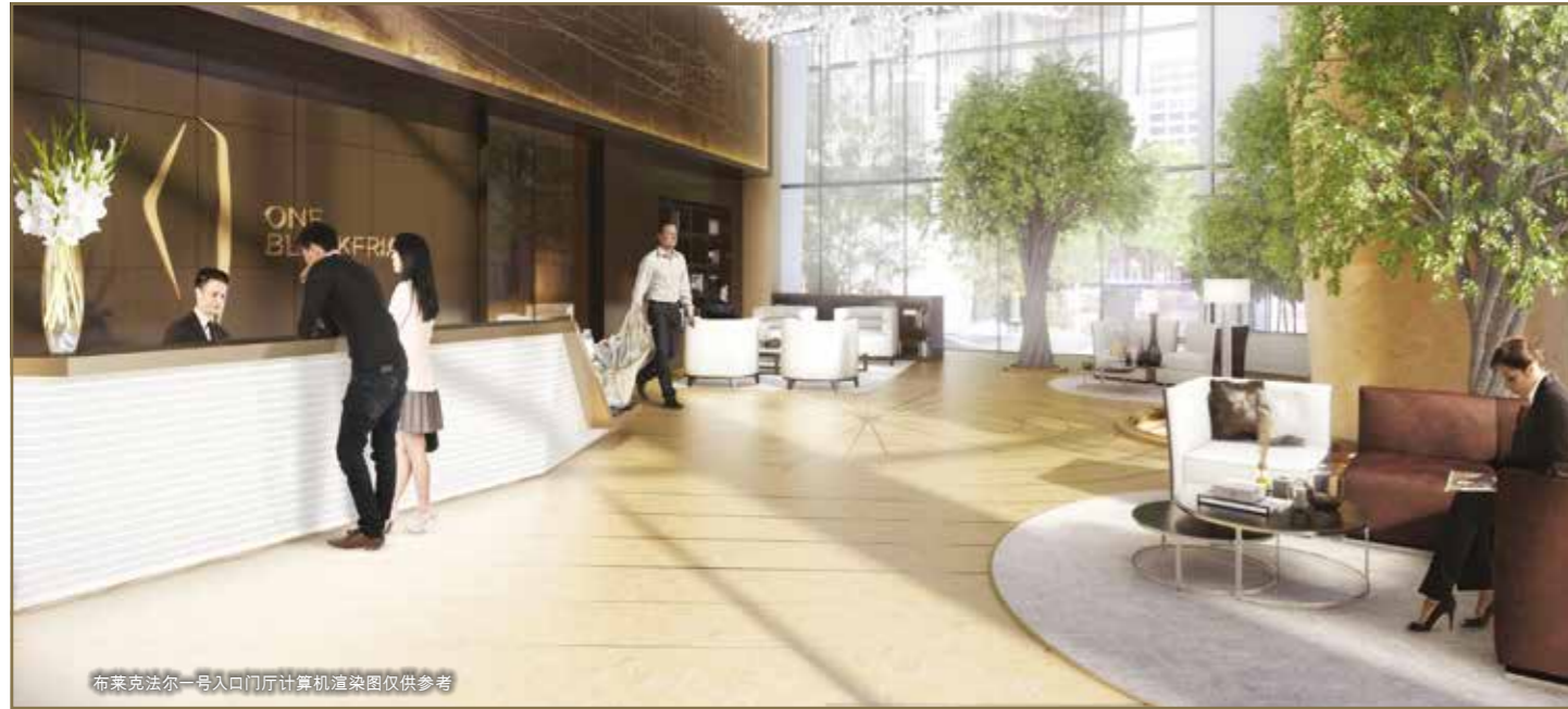
布莱克法尔一号入口门厅计算机渲染图仅供参考