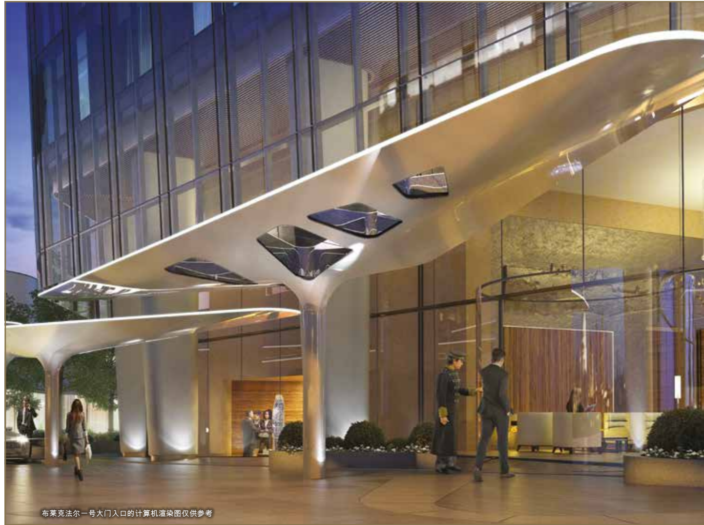
布莱克法尔一号大门入口的计算机渲染图仅供参考