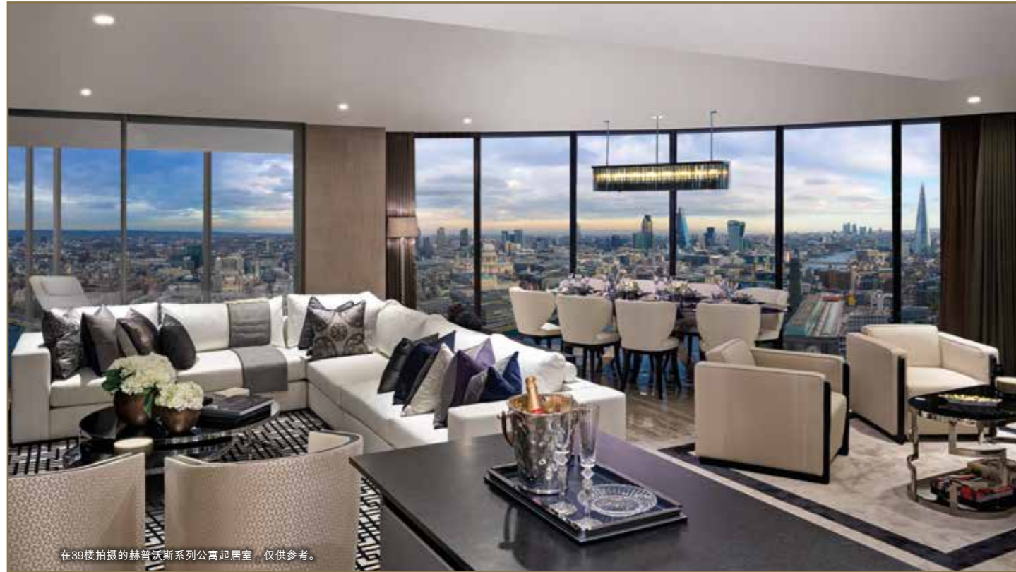
在39楼拍摄的赫普沃斯系列公寓起居室，仅供参考。