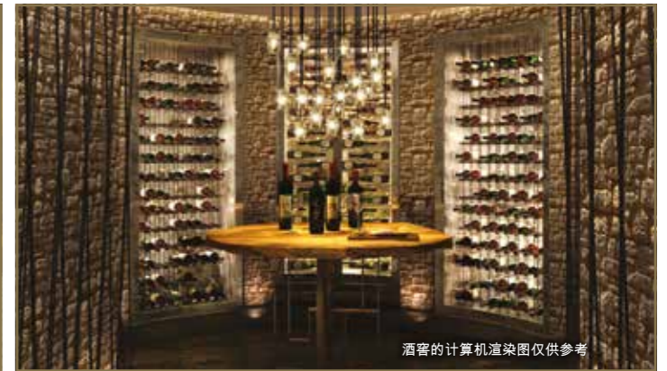
酒窖的计算机渲染图仅供参考