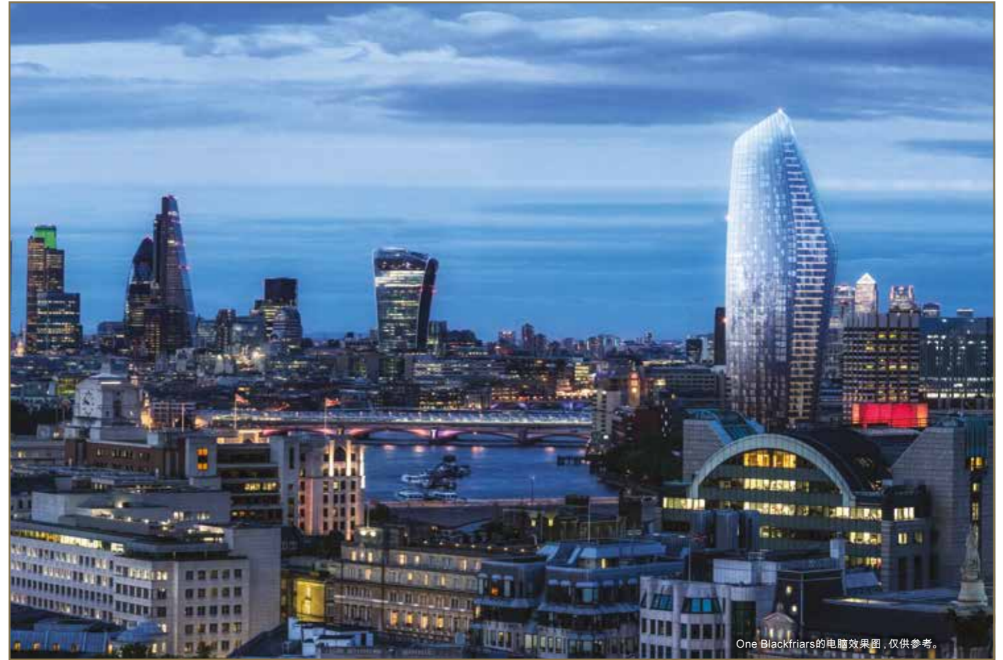
One Blackfriars的电脑效果图, 仅供参考。