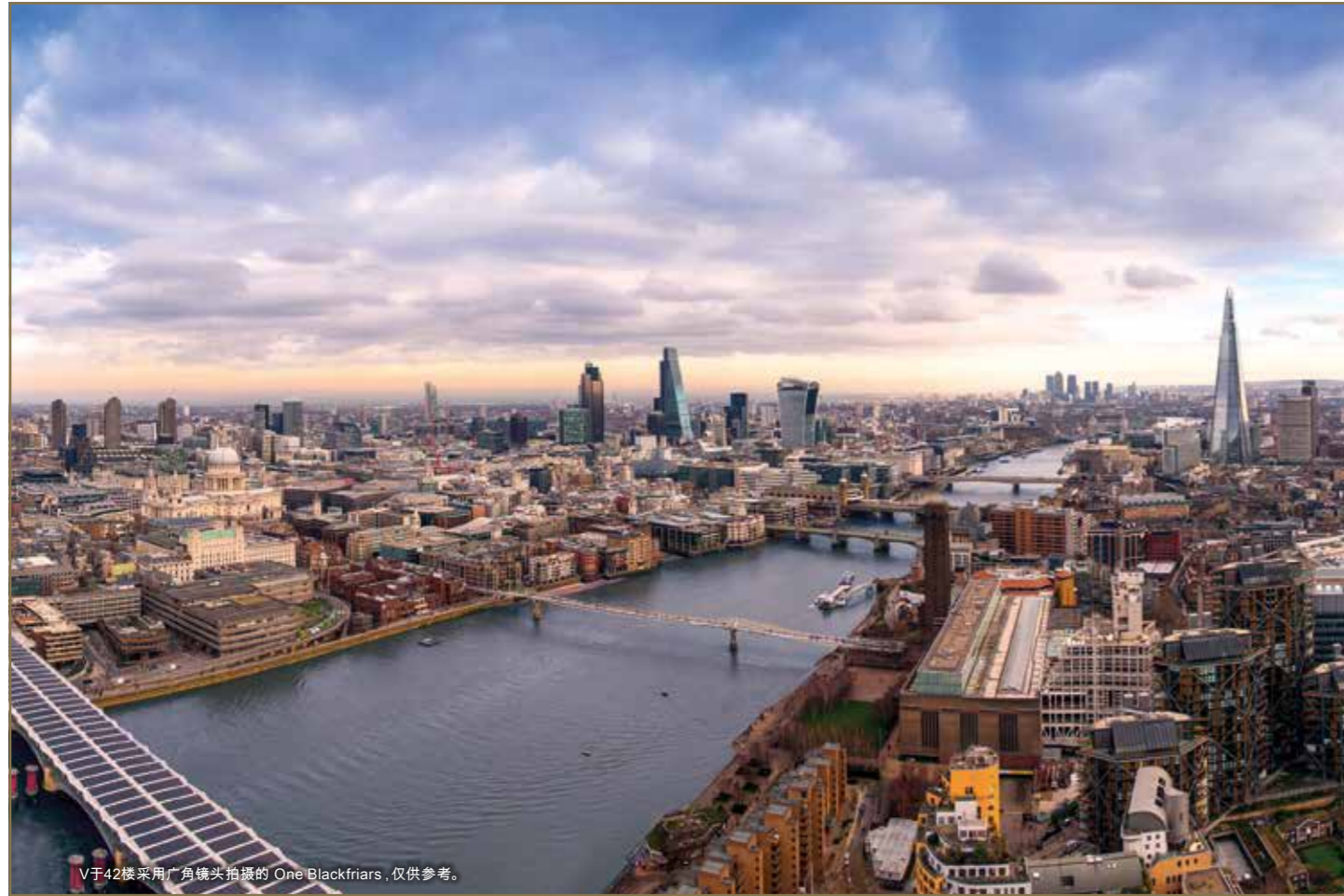
V于42楼采用广角镜头拍摄的 One Blackfriars, 仅供参考。