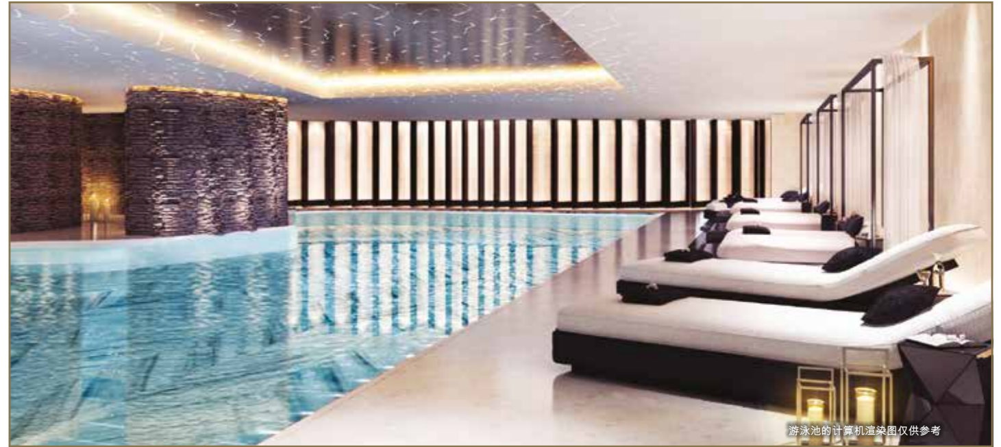
游泳池的计算机渲染图仅供参考