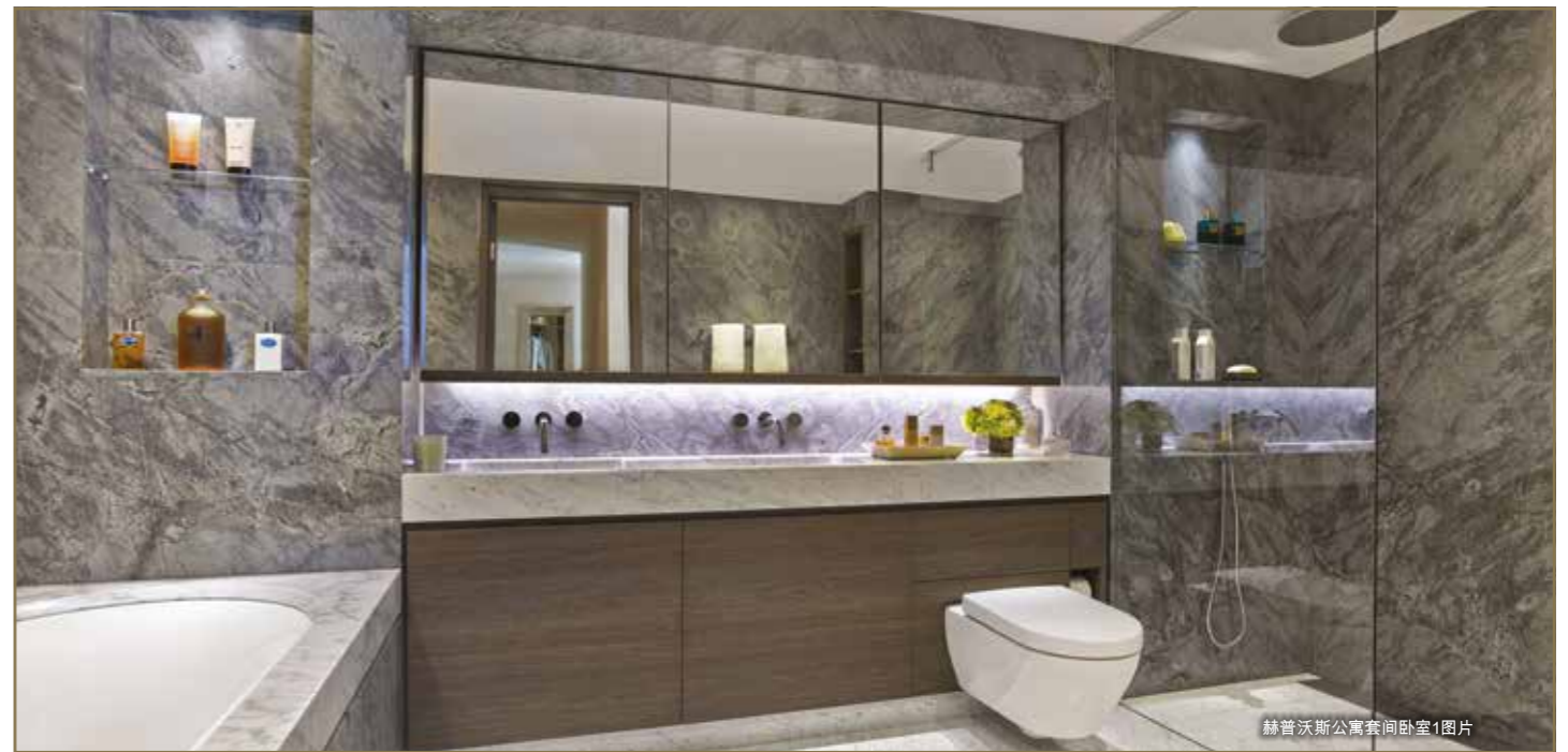
赫普沃斯公寓套间卧室1图片